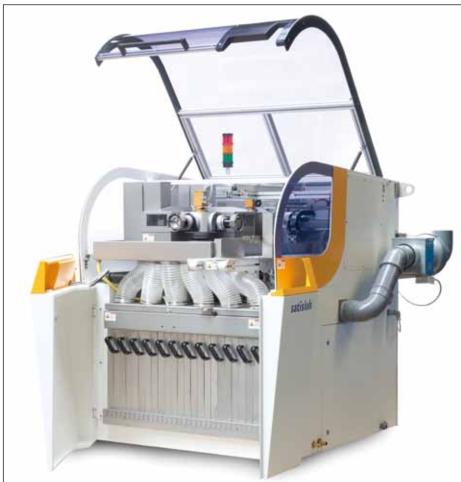
Hightech-systeem voor de brillenglasindustrie.

A ddit is een internationaal opererende process supplier, contract manufacturer en system supplier van precisieplaatwerkdelen en -producten, modules, systemen, complete apparaten en machines voor Original Equipment Manufacturers. Het bedrijf biedt daarnaast ook aanvullende diensten aan, zoals productontwikkeling en logistieke dienstverle-